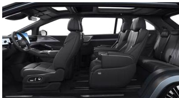
Tapicerka Meteorite Black