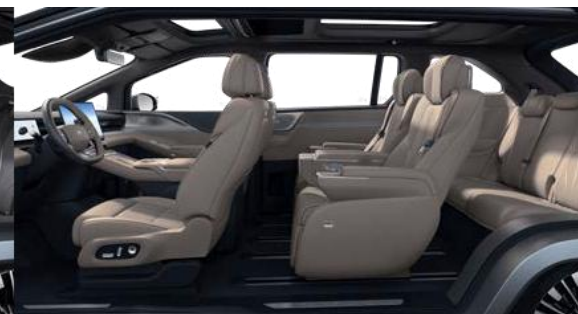
Tapicerka Moon Shadow Coffee