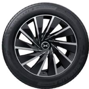
Obręcze kół 20-calowe Nebula