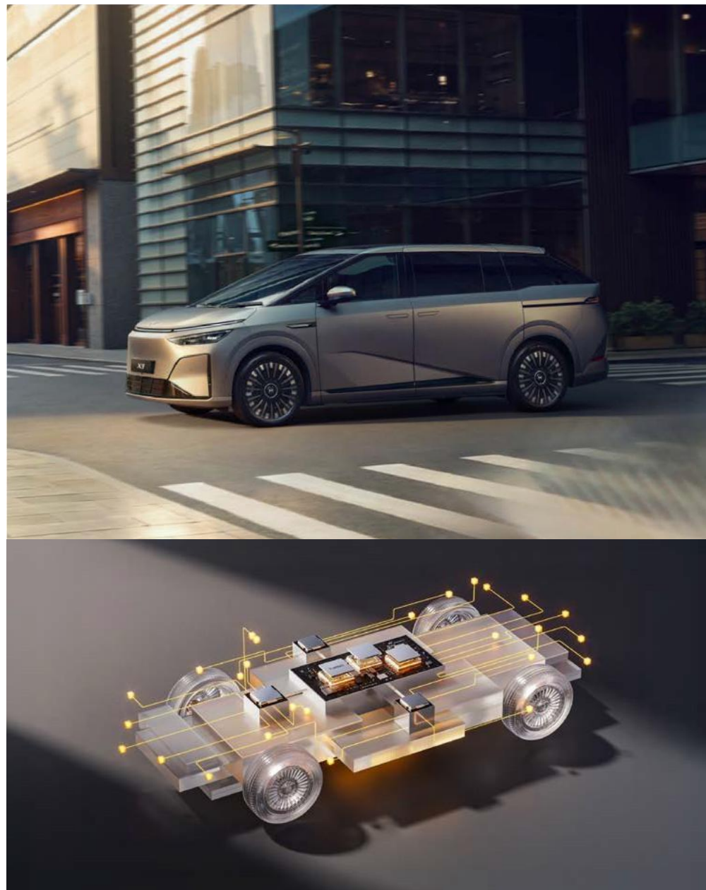
XPiLOT ASSIST 3.0

Systemy wspomagania nigdy nie zastępują w pełni kierowcy. Kierowca jest wciąż odpowiedzialny za obserwację otoczenia celem uniknięcia kolizji oraz jazdę zgodnie z przepisami ruchu.